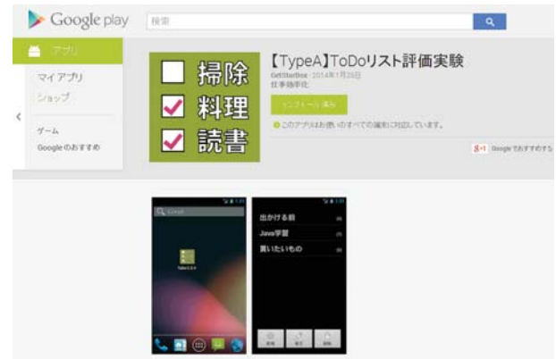
図 3 google play

本研究では、時間コスト設定の 1 要因による被験者間実験を行い、効果を計測した。