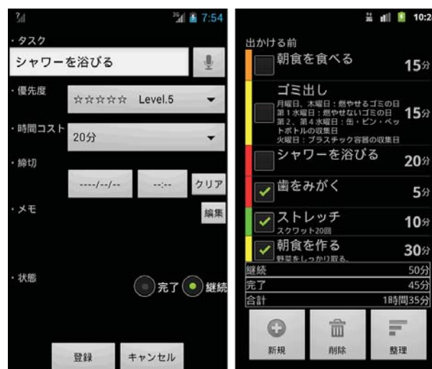
図 1 時間コストありの ToDo リスト

谷岡らは各ユーザがスマートフォンやタブレット端末から入力したタスクをプロジェクターで公開し、グループ内でタスクを共有するシステムを開発した [5]。このシステムは、android アプリケーションから入力したタスクをサーバ上のデータベースで管理され、プロジェクター上でタスクを泡で見立てて表示させている。泡はタスクの種類や期限設定によって大きさや色が異なり、Kinect を用いることでユーザが泡を操作することができ、触れるとタスク情報がプロジェクターで表示される仕組みになっている。本研究