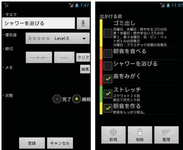
図 2 時間コストなしの ToDo リスト