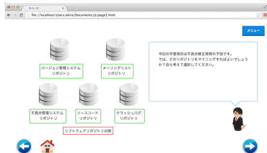
図2 シミュレーション環境の画面例