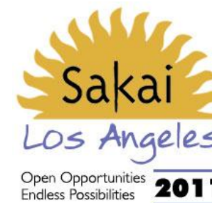
図 1 第 12 回 Sakai Conference ロゴ

The 12th Sakai Conference was held at Los Angeles, U.S.A. on June 14th - 16th, 2011. This paper reports the latest information captured through the conference, including that of the Sakai direction projected from 137 sessions, technologies useful to Japanese universities in near future like Matterhorn project, BASIC LTI, Mobile, and ePortfolio. And the activity of Ja Sakai during this Sakai Conference is also informed.