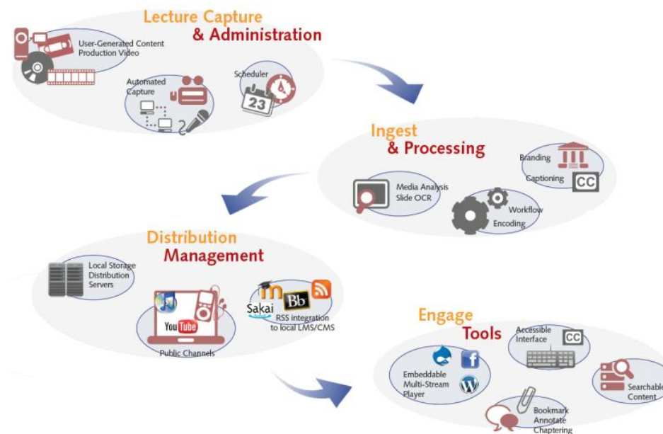
図 3 Matterhorn システム概要

しかしながら、現状の Matterhorn 1.2.0 では i18n の仕組みが実装されておらず、ビデオタイトルなどに日本語の入力ができない。またビデオキャプチャ機器に対する構成ガイドが限定されているため、日本の大学において運用レベルで利用するためには日本からの多くの貢献が必要であろう。