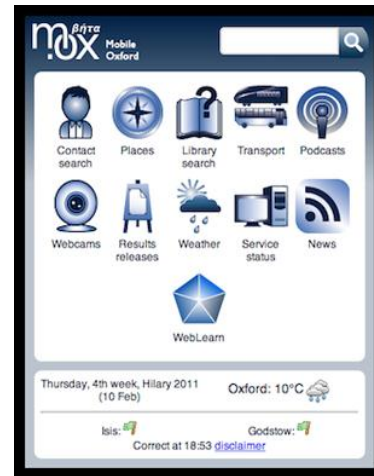
図 7 Mobile Oxford トップ画面

WebLearn とは、University of Oxford 版 Sakai の名称である。モバイルに対応している一部機能が利用可能である。