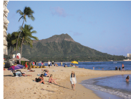
図 16 会場そばのビーチの様子 Fig. 16 The beach next to the Venue