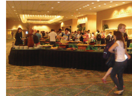
図9 朝食の様子 Fig. 9 Breakfast at the conference venue

何であるのかを議論するため、このパネルが開催された。パネリストは以下の6名である。