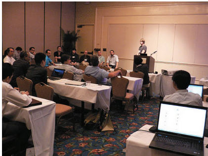
図 14 IWSC 2011 ディスカッションの様子 Fig. 14 A discussion session in IWSC 2011