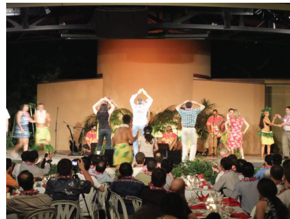
図 11 バンケットの様子 (2) Fig.11 Banquet (2)