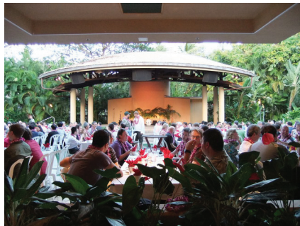
図 10 バンケットの様子 (1) Fig.10 Banquet (1)