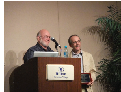
図8 MIP Award の Paolo Tonella への授与 Fig. 8 Paolo Tonella received MIP Award

産学連携の重要性は広く認識されているが、ICSEへの企業からの参加者は、第1回は約半数となっていたが、2010年では20%以下となっている。研究者と実務者の間にある溝が