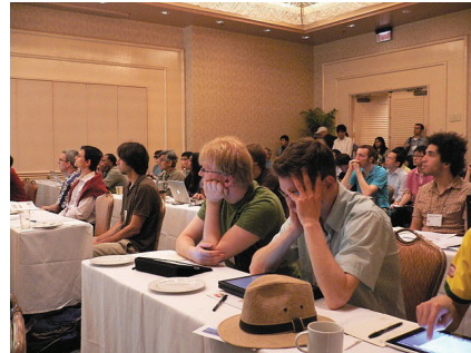
図 13 MSR 2011 の会場の様子 Fig. 13 A session in MSR 2011