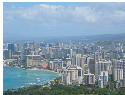
図1 ワイキキの景色 Fig.1 Waikiki