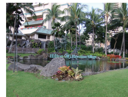
図2 会場となったヒルトンホテル Fig.2 Conference Venue

ル市ワイキキにある Hilton Hawaiian Village にて、5月21日から28日までの日程で開催された。開催期間のうち、本会議は5月25日から27日の3日間であり、本会議で採択されたソフトウェア工学全般の様々な研究に関する発表が行われた。その前後の日程では、ソフトウェア工学教育、ソフトウェアプロセス、リポジトリマイニング、自己適応システムという4つのテーマに関する国際会議と、特定の研究テーマに関する研究者が集まる22件のワークショップが開催された。