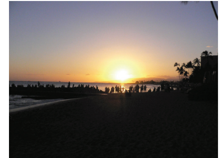
図 17 ビーチの夕陽 Fig. 17 Sunset at the beach