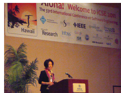
図 6 中小路先生による基調講演 Fig. 6 Keynote Talk by Kumiyo Nakakouji

1 日目の基調講演は、SRA の中小路久美代先生による“Interactivity, Continuity, Sketching, and Experience”。ソフトウェア開発者が所属している「作る」世界ではなく、ユーザにとっての「使う」視点から見たソフトウェアの開発、デザイン活動について、これまでの様々な取り組みが紹介された。このプレゼンテーションでは、491 枚という多数のスライドを使って多様な活動が紹介されていたが、研究者にとって重要な指摘の 1 つは、ソフトウェアおよび研究の評価に関して、正しい評価方法を選んでいないものをよく見る、という指摘である。新しく作られた道具というのは、本人の能力自体を伸ばすもの（たとえばダンベル）、本人の行動を助けるもの（たとえばランニングシューズ）、新しい経験を提供するもの（たとえばスキー）の 3 つに分類することができ、能力を伸ばすものであれば使用前後での使用者の能力の変化、行動を助けるものであれば使用の有無による能力の違いを評価することが妥当であるが、新しい経験を提供するものについては、そもそも評価したい