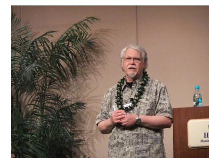
図 7 Bill Dresselhaus による基調講演 Fig. 7 Keynote Talk by Bill Dresselhaus