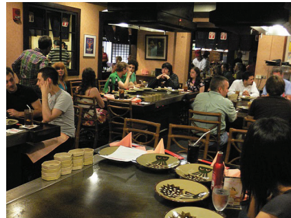
図 15 IWSC 2011 の夕食会 Fig. 15 Workshop Dinner in IWSC 2011

第1著者は、併設ワークショップのうち、IWSCに参加した。これはコードクローンを扱うワークショップで、新しいコードクローンの検出手法や、ソースコードの差分を分かりやすく可視化するための手法など、様々な研究が発表された。参加者は30名を超えており、主に学生が最新の研究成果を発表し討論する、非常に活気のあるワークショップとなっていた。図14は、IWSCでの議論の様子である。1セッションで論文を発表した著者らが全員、前の椅子に並んで座り、個別の研究内容よりも幅広いテーマで他の参加者と議論を交わっていた。