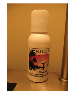
図 5 参加者に配られた日焼け止め