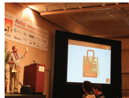
図 4 オープニングの様子 (Richard N. Taylor)