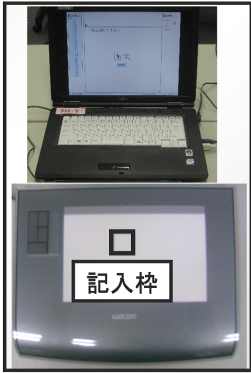
図 2 使用機器

され，Frame 2 に問題表示と解答記述，Frame 3 に解答履歴と文字認識結果が表示される．被験者は e テストシステム中央の枠内にペンタブレットにより解答を記入する．解答記入後，送信ボタンを押すと，書いた文字の筆記情報がサーバに送信される．ペンタブレットには記入の目安となる枠が表示されており ( 図 2 枠内 ) ，この記入枠と e テストシステムの枠とが対応している．なお，システム開発言語は Perl/CGI と Java である．