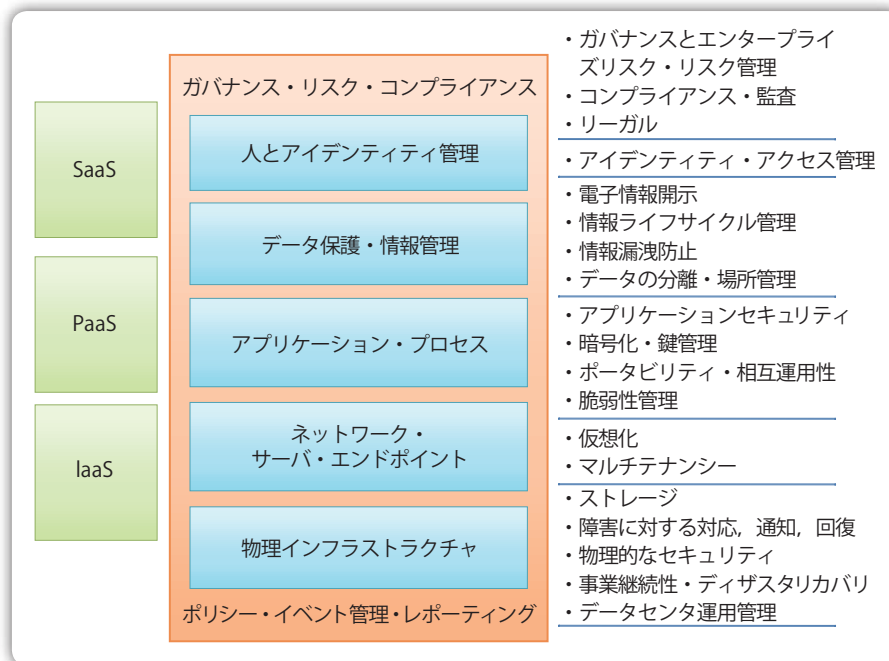
図-2 セキュリティフレームワークのスタック