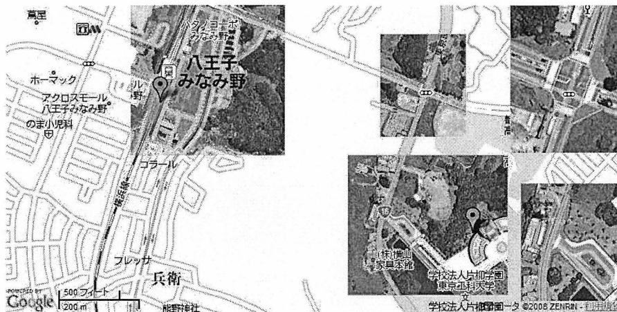
図8 作成した地図画像