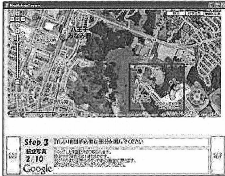
図6 航空写真のキャプチャ

他に詳細な地図が必要な場合は、右クリックまたは戻るボタンで前の画面(2)に戻り、地図の移動を行う。