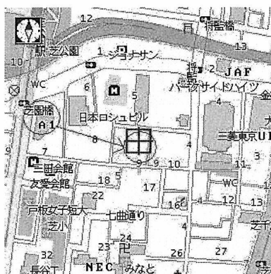
図1 リクナビ掲載の地図

図1にリクナビ[3]の地図を示す。建物が省略されているため、実際の風景と異なる。そのため、地図と実際の風景が大きく違うため現在地を把握しづらく、目的地周辺についても目的地の建物がわかりにくいという問題がある。また、この地図では左上の丸から画面中央の丸に行きたいのだが出発点不明であり、目的地も四角形のポインタが表示されているだけで不正確である。