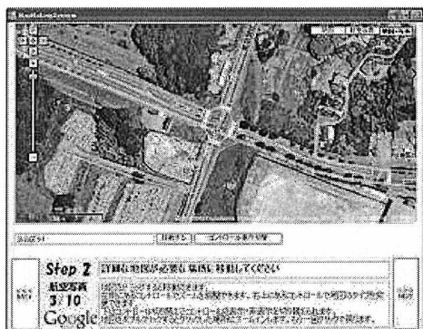
図 5 詳細が必要な部分へ移動

自動的に航空写真の地図に画面が変わる。目的の位置に達したら、左側にあるコントロールでズームを調整し、右上にあるコントロールで地図のタイプを変更する。