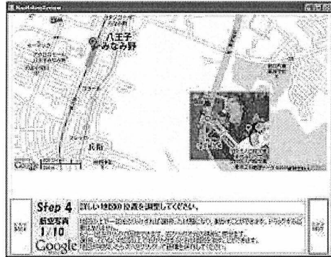
図7 地図と航空写真の合成

通常は以上の操作で地図は完成する。詳しい地図を動かしたい場合は、地図を左クリックして選択して自由に動かすことができる。もう一度クリックすることで位置を固定することができ、右クリックすると元の場所に戻すことができる。最終的に完成した画像を図8に示す。