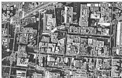
図2 航空写真を用いた地図

図1と同じ場所の Google Map の地図記号+航空写真の地図を図2に示す。縮尺が正確で、建物や路地が省略されていないため、実際の風景とのギャップは少ないが、広い範囲の地図を作ろうとすると建物、路地が小さくなりすぎてしまい、地図から情報を読み取ることが困難になり、広域の地図には不向きという問題がある。