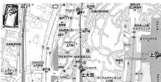
図 10 評価実験で使用した地図 2