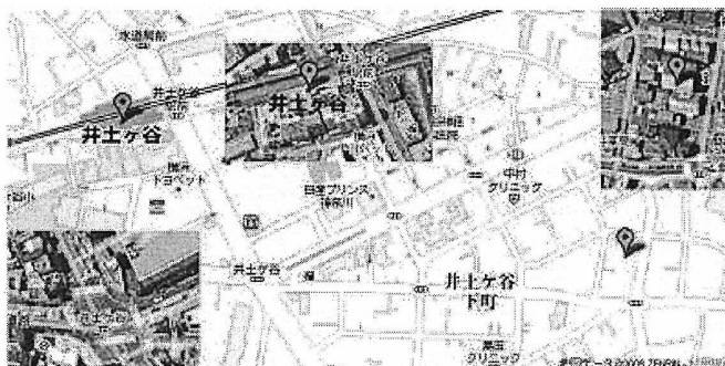
図 9 評価実験で使用した地図 1

を使用した。図 10 は、駅前の地図に縮尺の大きな通常の地図を設定し、航空写真を用いないで作成した地図である。駅前は建物や歩道橋などの遮蔽物が多い場合は航空写真でも道がわかりづらいことがあると考えられる。また、同様の理由より目的地周辺も縮尺の大きい通常の地図を用いた。