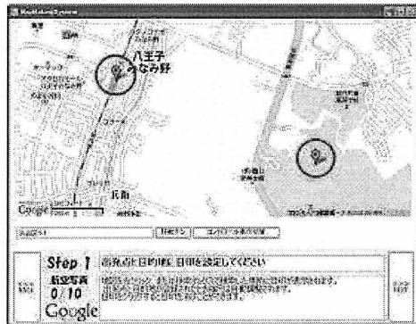
図 4 出発点と目的地の設定