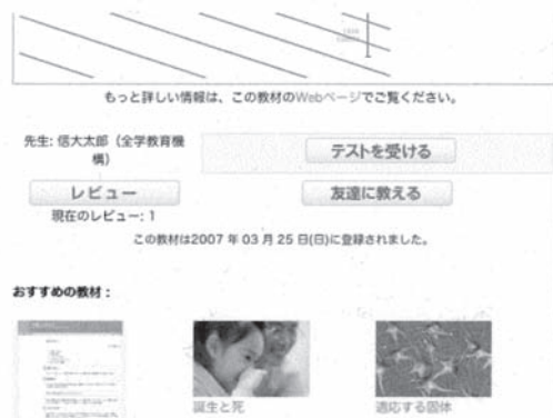
図2: 学習者評価ボタン、おすすめ教材の表示

ここでは「商品」紹介における商品説明および商品画像提示機能を活用している。右カラム内にはアクセスランキングなどに応じたおすすめ「商品」も表示される。また検索窓もある。今のところ検索対象は「商品」名、すなわち教材タイトルである。