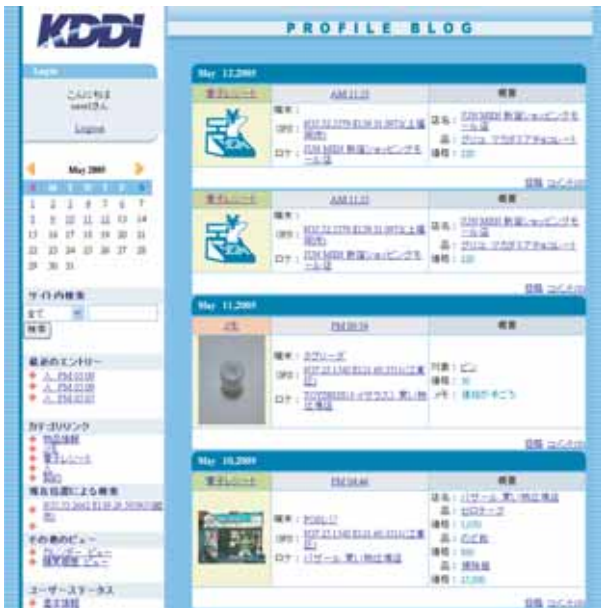
図 3: Profile Blog のメイン画面 [1].