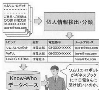
図4 Know-Who データベースの構築・更新

文書から個人情報を自動で検出する技術は、人による Know-Who データの登録作業を代替または補完する手段として利用できる。別途、各文書から主要なトピックやキーワードを抽出する手段が必要となるが、例えば予め製品名のリストがあれば、その製品名を含む文書から個人情報を検出することで、誰がその製品と関係しているかが分かる。