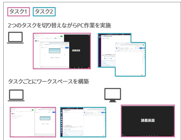
図 2 ワークスペース構築の動作例

していることを推測し、もう一方のディスプレイに全画面表示で配置する。タスク 2 の場合、ドキュメント作成時にコミュニケーションツールを併用することが多いと推測し、2 つのウィンドウを並べて配置する。