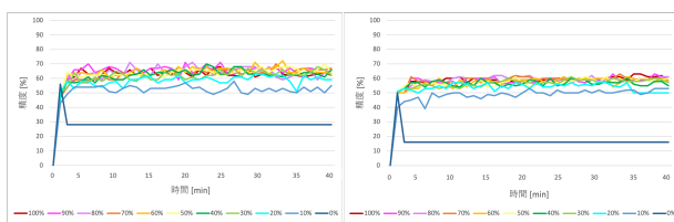
図3: 一般的なデータを10人とした際の精度 図4: 一般的なデータを20人とした際の精度

しかし、エッジサーバの全てのデータを送受信することは非現実的であるため、一部のみを受け取ることを考える。エッジサーバからエッジデバイスへと送信するデータ量をエッジサーバのデータの0~10割と変化させた際の結果を図3~5に示す。