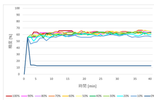
図5: 一般的なデータを30人とした際の精度

一般的なデータを一切含めずに個人情報のみで学習した0割の際は、一般的なデータに対応できずに低い