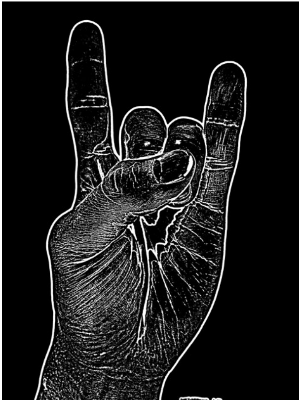
図 4 被験者 F の画像 Fig. 4 Image of examinee F

た手の形と角度で撮影されたものであることから、畳み込みニューラルネットワークによって手の輪郭の情報から個人を区別する特徴を抽出できなかったために起きたと考えられる。よって 50 \times 50 にリサイズした画像では本人確認に用いるのは難しいことがわかる。