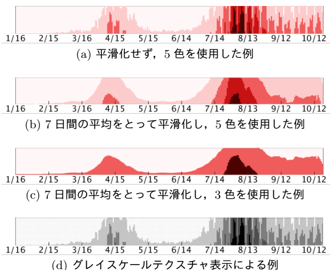
図 2: 時系列棒グラフを二色塗り分けスパークラインにした例. (a) に比べ、平滑化した (b) の方が値を読み取りやすい. また、(c) のように色の個数を減らすことで値の増加や減少の速度がよりはっきりわかる. (d) のようなグレイスケールテキストチャ表示でも値を読み取れる.

ることが多い. しかし、1 行では図の詳細を読み取ることが難しいため、本稿では可視化の詳細と概要の両方を読み取ることに重点をおき、2 行で表示する方針を採用した.