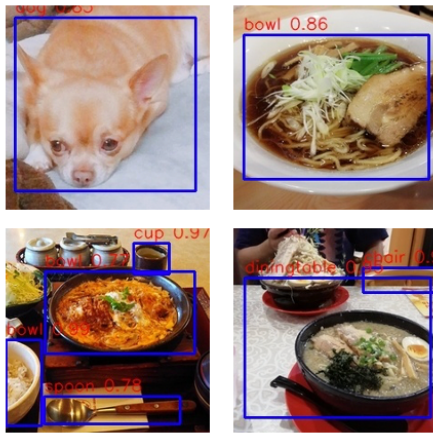
図 3 画像情報の抽出の例

もうまく対応できる。また、YOLOv3においてボックス座標とともにそれらの信頼度のスコアを同時に学習し予測することで、物体検出の精度を大きく向上させている。