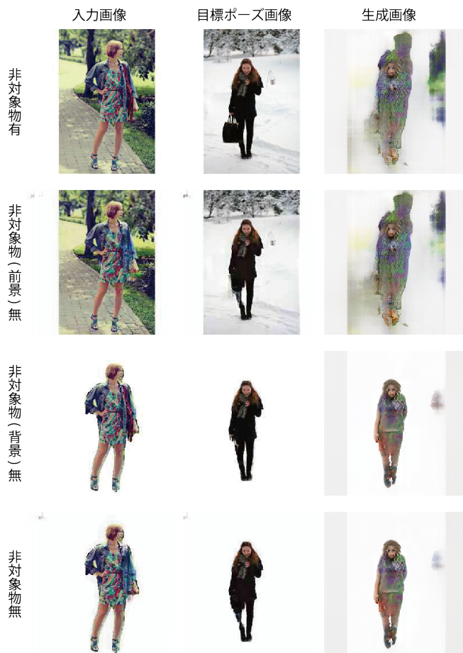
図 7 生成画像の輪郭の比較

また、生成画像の比較により、非対象物無の場合では輪郭が不鮮明になる点も改善されたことが確認された。特に、背景を取り除いた場合の生成画像が鮮明になることが確認