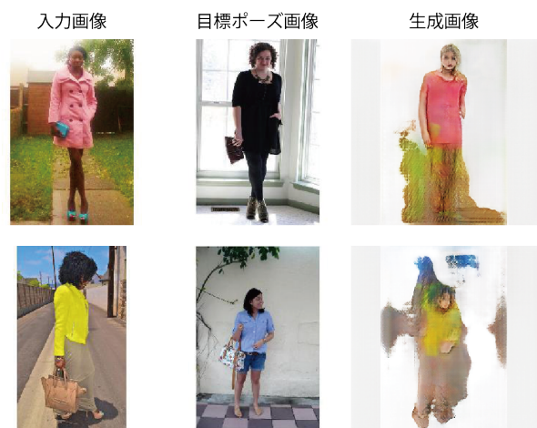
図 1 非対象物がある場合の劣化した生成画像

本研究では、非対象物を取り除いた人物画像によるポーズ画像生成手法を提案する。特に、図 1 のように生成画像に非対象物の色が色移りしてしまう場合や、輪郭が不鮮明になる場合の問題を改善する手法について説明する。提案手法は、図 2 に示すように、非対象物の除去による画像の