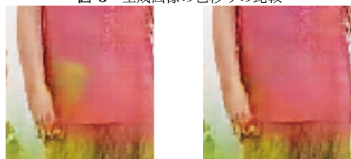
(a) 非対象物有 (b) 非対象物(前景)無