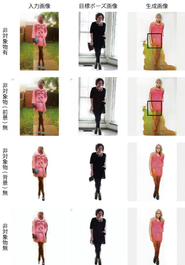
図 5 生成画像の色移りの比較