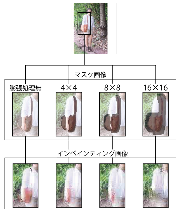
図 4 膨張処理をしたマスク画像とインペインティング画像

フォロジー処理によって膨張処理をしたマスク画像を作成した。膨張処理は図 4 に示すように、 4 \times 4 、 8 \times 8 、 16 \times 16 サイズの計 3 種類のカーネルで行った。図 4 より、膨張させるサイズが大きくなると、前景部分の取り除かれる範囲が広がるが、その分画像がぼけやすくなることが確認された。