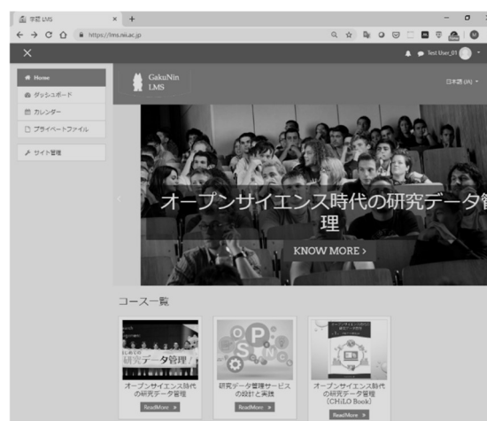
図 1 学認 LMS

標準規格に基づく教材配信機能を実装したところ、Moodle 標準の LTI プラグインでは LTI によるアプリケーション間認証に基づき、コンシューマ側からプロバイダ側に displayname , email などの個人情報が取り込まれるため、これらをフィルタリングして秘匿するカスタマイズを行った。また、学習履歴データの標準規格である xAPI[8], Caliper Analytics[9]準拠のログを高等教育機関が取得できる環境を構築することにより、LTI だけでは取得できない詳細なログを提供することを可能にした。本稿では各機能の詳細について報告を行う。