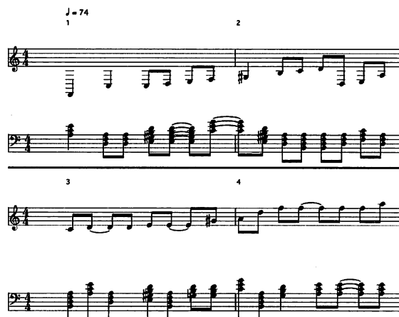
図6 実験2, “ガッカリ”から生成された楽曲

が高くなっている。これは語の印象に一致していると考えられる。“ヒンミパ”(表7)においては印象語群 c4が高くなっている。楽曲特徴値においては、“ニコニコ”の調は“E”というメジャーキーであり、テンポも145と速く、旋律音の平均が高い楽曲が生成されている。また、“ガッカリ”の調は“Am”というマイナーキーであり、テンポも比較的遅く、旋律音の平均も低い楽曲が生成されている。“ヒンミパ”においては、調は“Bb”というメジャーキーであり、テンポも比較的速い楽曲が生成さ