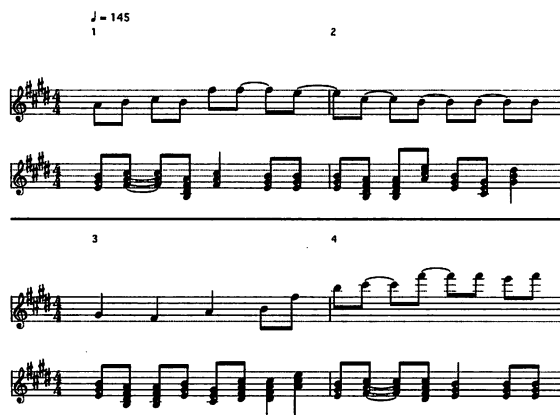
図5 実験2, “ニコニコ”から生成された楽曲