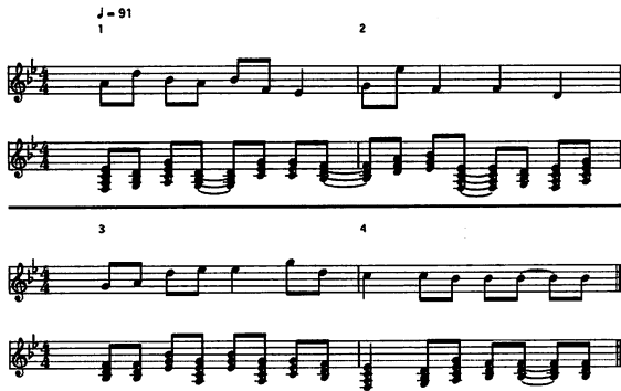
図7 実験2, “ヒンミバ” から生成された楽曲