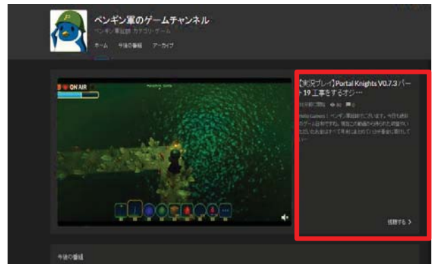
図1 チャンネルが配信する番組の詳細(画面右)

普段視聴しているチャンネルの番組であるか、または、新しいチャンネルの番組を視聴する場合は、チャンネルが配信する番組の詳細(図1)、ハッシュタグ(#freshlive)が付加された Twitter のツイート等の限られた情報から視聴したいと思う番組を直感的に選ぶこととなる。また、新しいチャンネルを知る手段として、FRESH!の関連チャンネル(図2)という視聴しているチャンネルと同じカテゴリの番組を新しく配信した5チャンネルを紹介する機能が存在する。