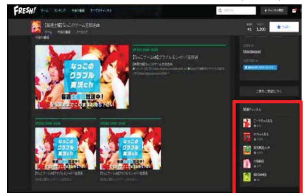
図2 視聴チャンネルの関連チャンネル(画面右下)