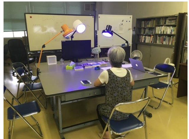
図 6 実験時の様子