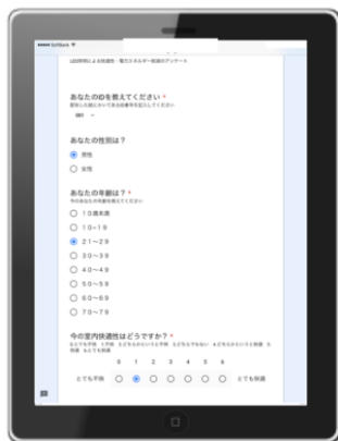
図 4 Web アンケート

本システムでは、AB テストを実施したが、提案照明コントロールなしの期間 A 中に被験者 ID と照明の色相と色調の情報を適合させた。その後、提案照明システムコントロールありの B 期間では、このデータをもとに各被験者に最も適した照明をクライアント PC 上でフィードバック制御するために、同一ネットワーク上にある照明のネットワーク化に必要な有線ルータにつながっているコンポーネントのひとつであるブリッジを介して、照明を ZigBee Light Link 規格によって本実験で用いる間接照明 3 個を制御し、各被験者の好みの照明色を提示する。この照明の制御について図 5 にて示す。