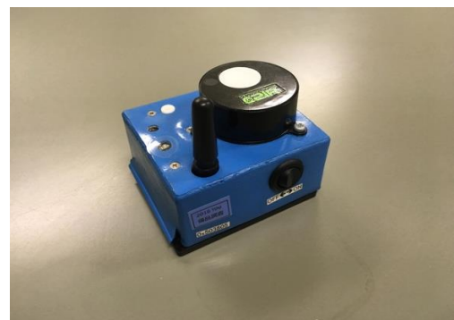
図 2 無線環境センサ