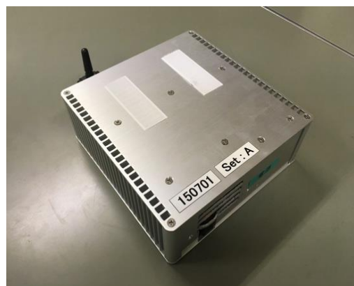
図 3 Linux サーバ