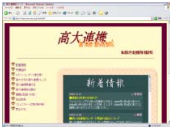
図 1 : Web システムトップページ

しかし、この高大連携の進展による連携高等学校の増加や受講者の増加は、受講者の管理の複雑化や授業後のフォロー不足など新たな問題を引き起こすことが予想される。そのためインターネット利用の遠隔講義の発展に支障をきたすおそれがある。そこでこれらの問題を解決すべく、またインターネット利用の遠隔講義をより効果的に実施するために Web システムの開発を行った。図 1 は Web システムのトップページである。