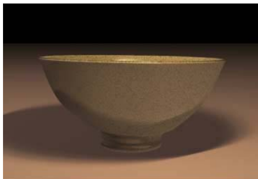
図3：レイトレーシング実行結果