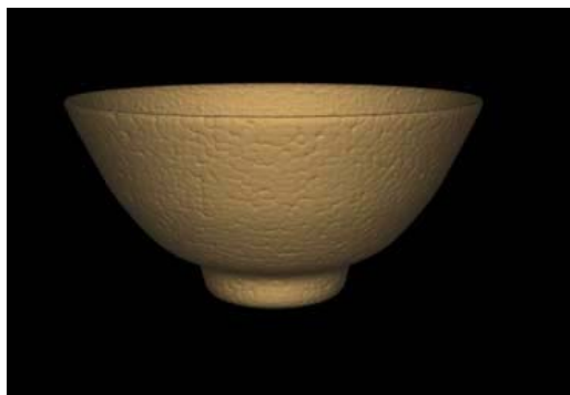
図2：シェーダ実行結果