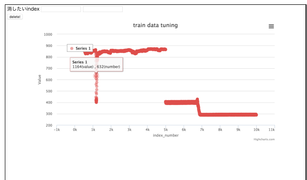
図4 グラフ表示画面

Pandas を用いて値をデータフレームに変換する。データフレームに変換を行うことで、データの削除、並替え、追加を行うことができる。値をデータフレームに変換後、CSV に変換し、オリジナル教師データとして保存を行う。CSV に変換する理由として次の2点が挙げられる。