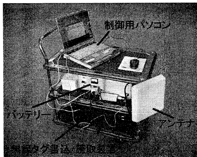
写真1 試作システムの外観

とが保証されない点がネックである。多くのタグに同じ情報を冗長に書き込んでおくことで伝達可能性を高めるといふ原始的な方法が一つの解決策になろう。