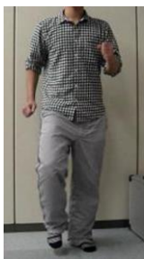
図 2. Walking

ユーザには、身体動作をしている間、常に好みの映像が閲覧できるような環境が必要となる。一方で、我々の考えるインタフェースではディスプレイはユーザの正面に置かれている。このため、ユーザが全く自由に身体動作するとディスプレイから視線が外れてしまうことになる。そこで、自然な実生活での動作を取り入れつつ、ディスプレイを常に見続けることができるようにするための制限が必要になる。ここで、制限とはディスプレイから視線が離れない範囲でユーザの身体動作を制限することである。動作認識は、ユーザの視線制限を考慮してパラメータ調整を行う。