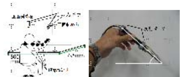
図2:実験環境と半田ごてに取り付けるマーカの位置 (右:実験環境 左:反射マーカの位置)