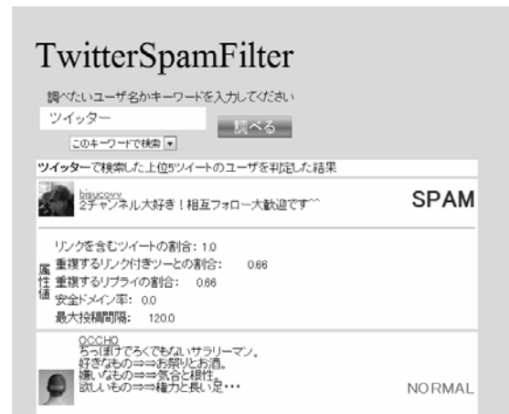
図2. システムのインタフェース