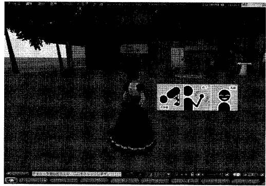
図 3: ジェスチャ選択インターフェース

ここで、ユーザがアイコンからジェスチャを選択すると、選択結果はアバターに反映され、アバターが選択されたジェスチャを行う。同時に選択結果を Dictionary