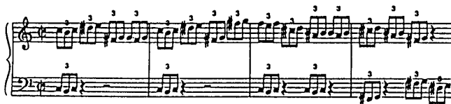
(fig 3-b Variation2)