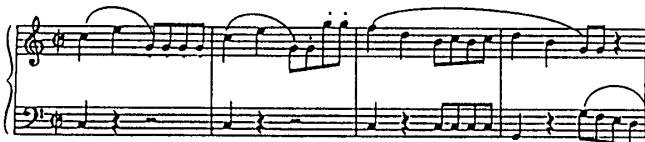
(fig 3-a Variation1)

基本となる曲のリズムを変えたり間に別の音を挿入する。後で述べる速度変化、拍子変化による変奏においても、この音型の変奏が基本となる。全部の音符をトレモロのように分割する方法や、各拍ごとに3連符を作り出す方法である。fig2の例にある上段の曲について、例を2、3あげる。(fig3-a,b)