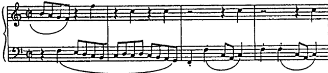
(fig 2 Reversal on Musical Note)