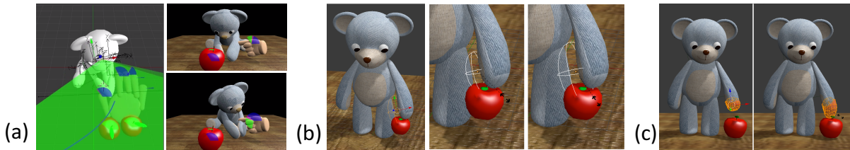
図 2 開発環境の利用例