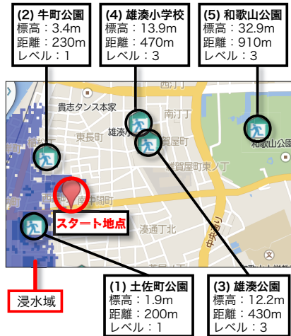
図 5 実験場所周辺の避難所*5