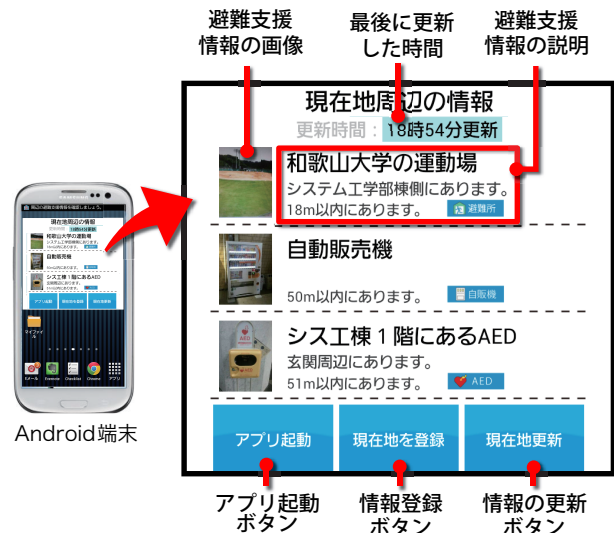
図 4 ウィジェット画面例