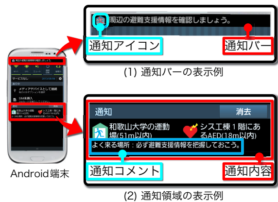
図 2 通知画面例