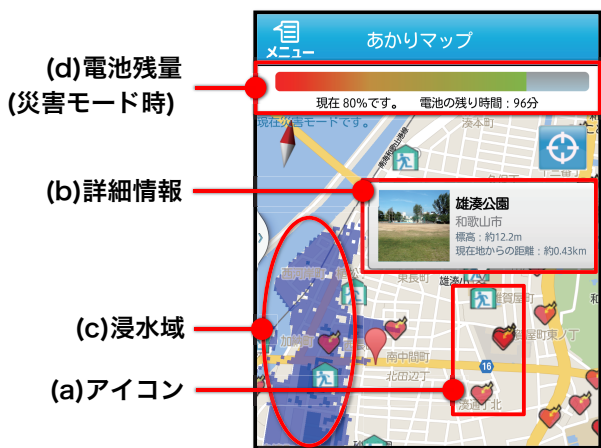
図 3 地図画面例