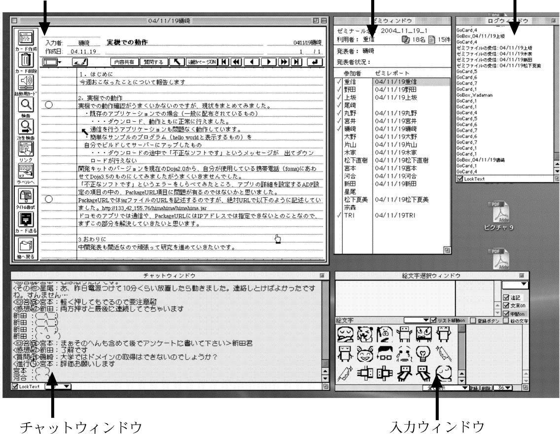
図 1 電子ゼミナールシステムの利用画面 Fig. 1 An example screen of electronic seminar system.

用には、操作権の取得は必要もなく、参加者全員が使いたいときに、いつでも使える。したがって、セマンティック・チャットの使用は、ゼミナールに関係ないインフォーマルなコミュニケーションにも使用可能となっている。