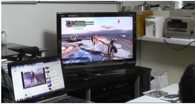
図 3 実験の環境