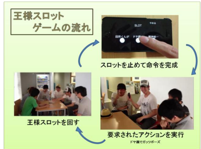
【図 2:王様スロットのゲームシステム 1】

命令文は 3 つの語句で構成され、ドラムの左側から名前、修飾語、動詞の順番に対応している。さらに、スマートフォンに搭載された「加速度センサ」「ジャイロセンサ」「近接センサ」「カメラ機能」の各センサを用いて、プレイヤーが命令を遂行したかをスマートフォン自体が識別することで公平な判定を行い、ゲームルールを成立させている。