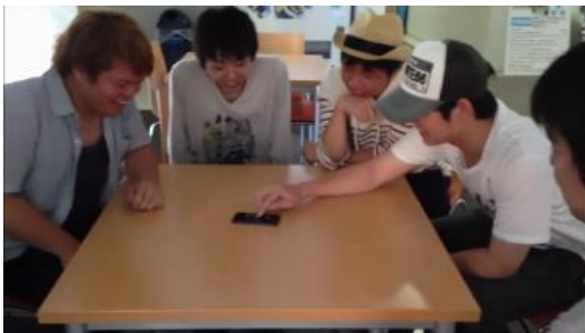
【図1：王様スロットの利用の様子】

本論文で提案する「王様スロット」は、従来のスマートフォン用アプリとは異なる実世界指向のエンタテインメント体験を実現させる「デバイスの外側に面白さを設計したゲーム」である。