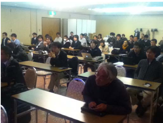
図 2 全体セッションの様子

ワークショップは例年通り1泊2日で行われ, 1日目の昼過ぎに開始され, 2日目の昼過ぎに終了した。プログラムも例年通りで, まず全体セッションで参加者全員が顔を合わせた後, 各テーマに分かれてテーマ別のセッションを行った。夕食後にはナイトセッションを開催し, テーマにこだわらず参加者同士が自由に集まり様々な話題について肩のこらない議論を行った。昼間のテーマ別セッションに比べて, ナイトセッションはカジュアルな議論の場であるが, 様々な情報を交換し, また交流を広げる良いチャンスになったようである。テーマ別セッションに加え, ナイトセッションでの参加者同士の交流を楽しみにしている参加者も多いようで, このような交流の場の提供も研究会の重要な役割かもしれない。2日目は朝から昼前まで各テーマセッションでの議論を続け, その後全体セッションで各セッションの議論内容を報告した後, 閉会した。