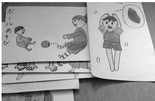
図 6 コミュニケーション・ボード

例えば図 6 は、聴覚障害児がコミュニケーションのトレーニングを受ける時に、発話と共に提示するボードの一例である。このようなボードを用いることで、視覚的に「何について話しているか」を固定することで、「状況を提示する」状態をつくりだしているといえる。