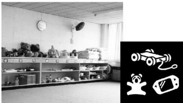
図 8 状況提示用のイメージ Figure 8 Definition of Situation Image.

対応させて表示させることとした。イメージには、状況をわかりやすく説明できるよう場面の写真と、状況をしめす Pictogram を併記した。Pictogram は JIS 規格のものうち、テストに該当する聴覚障害児の教育場面において頻度が高いもの限定した (図 8)