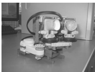
図1 方向制御可能な指向性センサノード