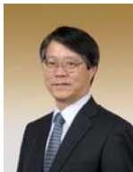
宮部博史（正会員：フェロー）

1977年東北大学博士課程修了。1990年同大学工学部教授を経て1993年同大学電気通信研究所教授。2010年東北大学名誉教授、同大学電気通信研究所客員教授、公立ほこだて未来大学理事。2011年中央大学研究開発機構教授。情報通信システムの構成、人と情報環境の共生などの研究に従事。IEEEフェロー、電子情報通信学会フェロー、情報処理学会フェロー、文部科学大臣表彰「研究部門」、情報処理学会功績賞、電子情報通信学会業績賞および功績賞など受賞。1993年DPS研究会主査。情報処理学会会長(2009年5月～2011年6月)。ICTに基づいた人の暮らしと自然の共生に関する研究に従事、総務省：ICTグリーンイノベーション推進事業PREDICT「情報システムの省電力化を実現する次世代ネットワーク管理技術の研究開発」(2011-2013)推進中。