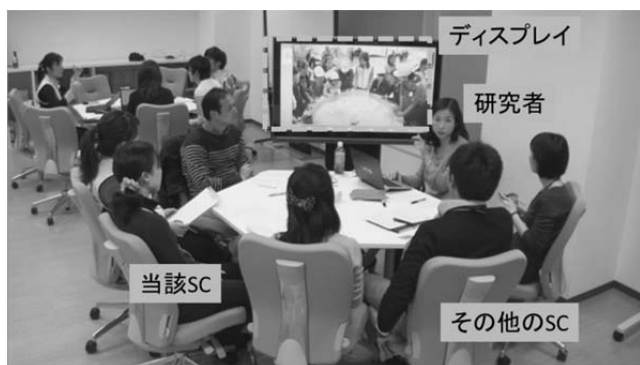
図 3 メタ認知 WS の様子

メタ認知 WS では、撮影対象となった SC の記憶が鮮明なうちに、データを他の SC と研究者とともに振り返ることにより、「このインタラクションの意図は何か」「どういった側面に注意を向けながらインタラクションを進めていたか」などを当該 SC に確認する。またキャリアの異なる他の SC からの評価を集め、当該インタラクションが「良いインタラクション」「悪いインタラクション」どちらに分類可能かを議論する。このような SC の専門的知識に基づいたインタラクションの評価を積極的に利用し、SC と来館者のインタラクション一つに対し、「良いインタラクション」「悪いインタラクション」といったメタレベルのラベリング手法を開発し、情報付与する。