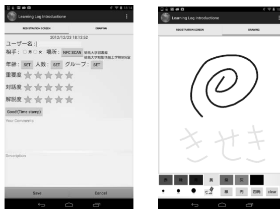
図 4 ラーニングログ

Android アプリを図 4 示す。展示物には NFC(Near Field Communication)シールを貼ることにより、Android 端末をかざすだけで、場所を記録する。この記録を分析することにより、対応した来館者の数や特性といったマクロな分析を行うとともに、重要な部分のビデオ映像を探して、SC の振り返りを支援する。