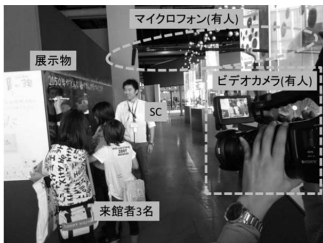
図1は2012年10月に撮影されたものである。インタラクション研究の目的で未来館にビデオカメラが入ったのは、初めてのことである。カメラマンが高性能ビデオカメラ(SONY PMW-EX1R)(メインカメラ)を構え、音声はSCが来館者とやり取りしている頭上から高性能マイクロフォン(SENNHEISER MKH 60P)で収録する。これらの映像と音声には収録時に同期信号を入れておき、事後的にコンピュータ上で時間同期を取る。カメラマンにはSCが正面から移るアングルでの撮影を依頼した。また上記のメインカメラの反対側から、研究者が家庭用ビデオカメラ(SONY HDR-CX500V)(サブカメラ)を構え、音声はSCの胸元にBluetoothマイクを装着させ、リアルタイムにカメラに伝送