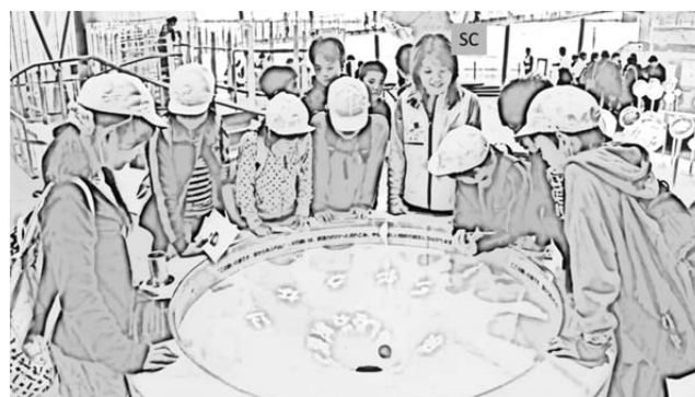
図 6 「願いの泉」で SC-1 が説明する様子

撮影は, 常設展示「未来をつくる: 技術革新の原動力」の中の「願いの泉(図 6)」「創造力の川(図 5)」「豊饒の海(図 1)」で実施された. この展示は, 技術革新を生み出す創造力を 5 つに分類し, 「願いの泉」から流れ出る 5 本の川として紹介している. その中で個々の展示において, エジソンから量子コンピュータまで, 革新的技術がどのような発想で生み出されるのかが紹介され, 最終的に川の終着点に設置されたホワイトボード(豊饒の海)に来館者が思い思いの未来の図を描くといったものである(e).