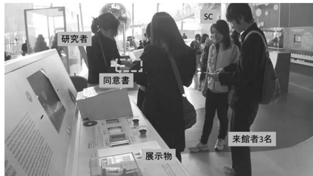
図 5 同意書へ署名する様子

(d). 未来館の展示スペースはオープンスペースのため, インタラクシオンの途中で来館者人数が変更する場合や, インタクション終了後にデータ収録に関する同意書にサインをもらえなかった場合があった. 同意書にサインをした来館者は 35 名(およそ半数)であった.