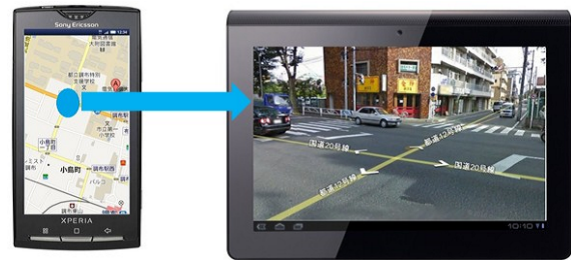
図 3 マップアプリケーションの連携操作 Fig. 3 Map Application using two devices.

マップアプリケーションでは、図 3 のように、スマートフォンに地図を表示し、地図上のタッチした点のストリートビューをタブレット端末に表示することで、地図を見ながら周辺の様子を確認出来、事前に目印となる建物などを道順と同時に確認することが可能となる。