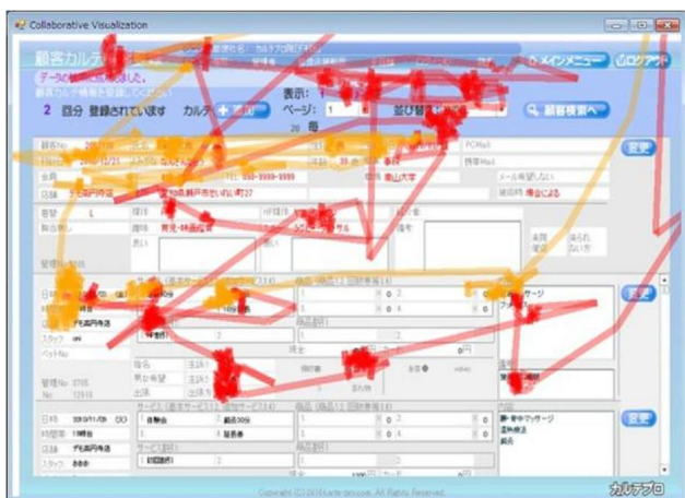
図 2 確認行動の比較の 1 例

本節では、実験で記録したインタラクシヨンデータをもとに薬剤師がどのように処方鑑査を進めているか分析し、薬剤師間の個人差や頻出パターンの抽出を進める予定である。多くの薬剤師は処方せんを確認する際にどのような手順で確認すれば見落としが少ないといった確認行動の情報共有は行われていない。そのため薬剤師間での確認行動に個人差があり、見落としといったヒューマンエラーにつながる確認行動も存在すると考えられる。そのため薬剤師間で ITR-Player[5]の Collaborative Visualization によるユーザのインタラクシヨンデータの可視化機能 (図 2) を用いて複数人の被験者の確認行動を比較し、どのような個人差が存在するか分析する。