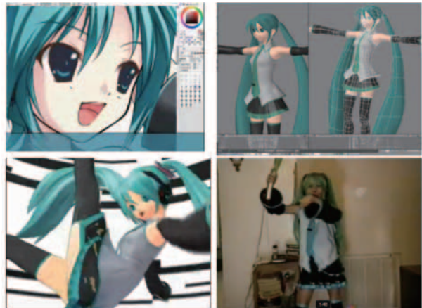
図-3 初音ミクの二次創作物

される“作品”が「初音ミク」を直接二次創作するものだけでない、ということである。創作された二次創作をもとに、三次創作、四次創作・・・N次創作というように、「創作の連鎖」が起こっているのが重要である。特に人気の高い作品は、高次の創作が行われることがあり、それが人気のバロメータになっている。