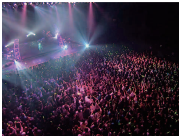
図-5 初音ミクのライブコンサート

実在しない架空のシンガーとして知られるに至った「初音ミク」だが、3Dコンピュータグラフィックの映像をスクリーンに投映することで、大きな会場でのライブコンサートを実現した。2009年8月31日に開催された「ミクフェス」 4) が最初のものであったが、その後、東京・札幌・ロサンゼルス・シンガポールでの公演を実現させた(図-5)。