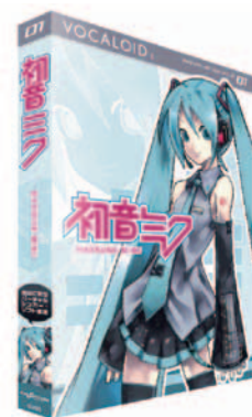
図-1 「VOCALOID2 初音ミク」

このように、「初音ミク」には、歌唱合成ソフトウェアと、キャラクターとしての2つの意味がある。