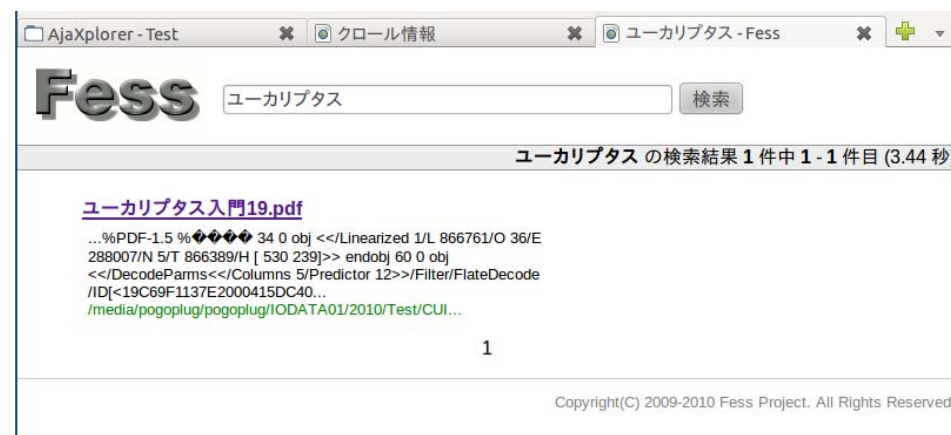
図 3. 検索結果 Fig.3 Search results

また、このシステムの運用を考えた際には電子書籍の閲覧だけでなく貸し出しを考慮した PDF ファイルの有効期限設定も必要である。PDF に期限を設ける方法についてはシステム概要で説明したとおりである。期限を設定された PDF ファイルは埋めこまれたスクリプトにより日付を取得し、指定した期限と照らし合わせ閲覧の可否を判定する。期限切れの PDF ファイルは指定した領域に、白紙などのレイヤを上から標示させられ閲覧できなくなる。しかし、PDF にスクリプトを組み込めるアプリケーションは限られており、現状では有効期限の設定は別アプリケーションから行うことしかできない。また、期限設定用のアプリケーションは AjaXplorer から呼び出しが出来ず、ユーザの貸し出し要求に対する自動的な有効期限設定は行えないことをここで断っておく。