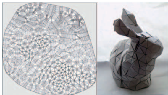
図-1 折紙化された Stanford Bunny（左：展開図，右：折りあがり）