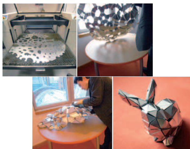
図-2 金属板の自由形状加工への応用（Cheung, K., Demaine, E. D., Demaine, M. L. とのコラボレーション）