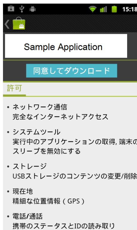
図 2 アプリのパーミッション

アプリはパーミッションを得ることでさまざまな機能を提供する API(Application Program Interface)を使うことができる。この API は図 1 の Application Framework 層に定義されている。一例として、READ_PHONE_STATE パーミッションによって使用することができる API の一覧を表 1 に示す。