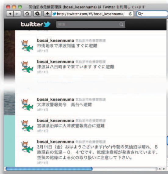
図-1 自治体による Twitter 利用の例。気仙沼市危機管理課の当日のツイート

首都圏でも、交通機関の運行状況、帰宅困難者のための避難場所の情報の入手に Twitter が役立った。避難場所の情報は東京都の Web ページにも掲載されたが過重なアクセスに耐えず、猪瀬直樹副知事 (inosenaoki) 自ら Twitter に情報を流した(図-2)。気仙沼の施設の子どもたちが公民館に取り残されているというツイート(施設の園長のメールを受信したイギリス在住の長男が発信した)を受けて、猪瀬副知事はヘリでの救助を手配し、12 日に全員救助された。