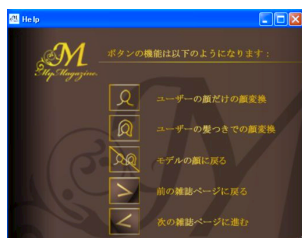
図 5 ヘルプ機能