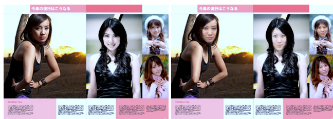
(a) 一般的な雑誌 (b) MyMagazine のイメージ