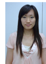
図 2 ユーザによる撮影写真