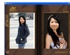
図 7 髪つきの顔入れ替え結果