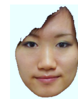
図 3 髪なしの顔写真