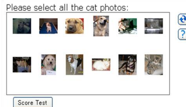
図 2 画像の CAPTCHA (Asirra) [6]

以下、2 章で既存研究の「4 コマ漫画 CAPTCHA」について簡単に紹介し、その課題を挙げる。3 章では 4 コマ漫画 CAPTCHA の課題に対しいくつかの解決策を示す。4 章でそれら解決策の有効性を比較実験により評価し、5 章で本稿をまとめる。