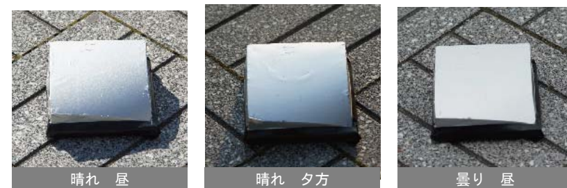
図 2 実物の曲面の環境による違い

同じ曲面であっても3つの環境下において明らかに印象が異なった。陰影がつくことでボリューム感を強く感じ、曲面の丸みが強調されると考えられる。