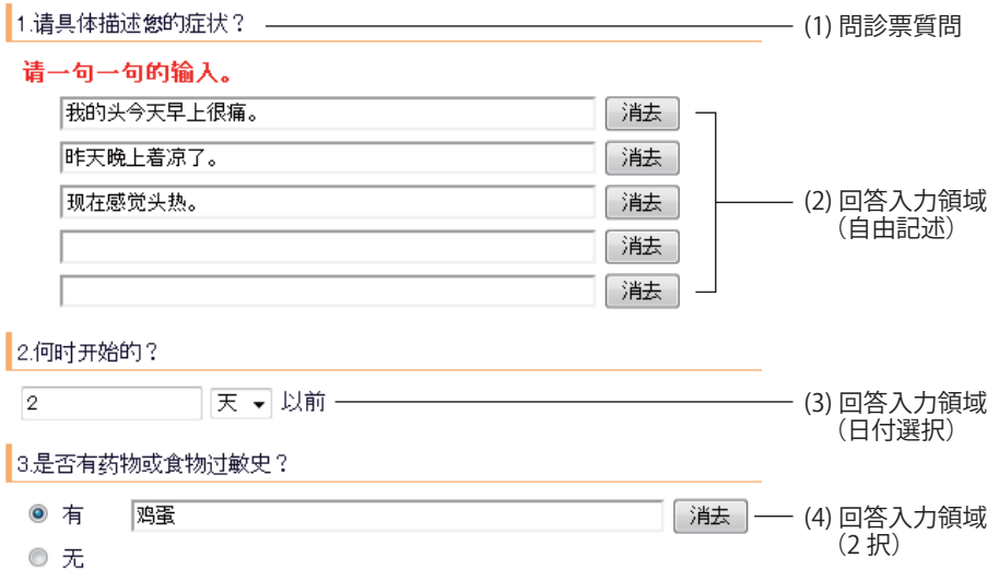
図 2 問診票入力機能の画面例